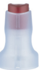
Införare och kanyl